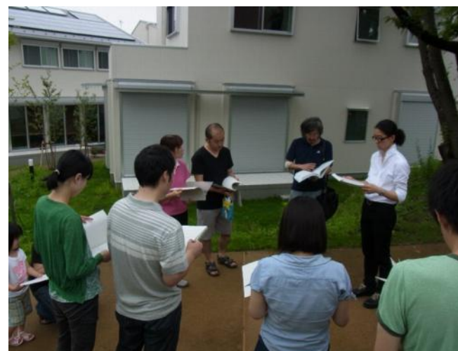
居住者への環境調査説明