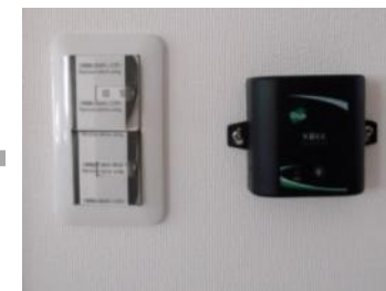
温湿度センサ (室内計測)