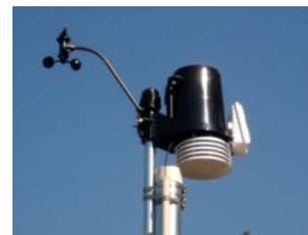
気象ステーション (屋外計測)